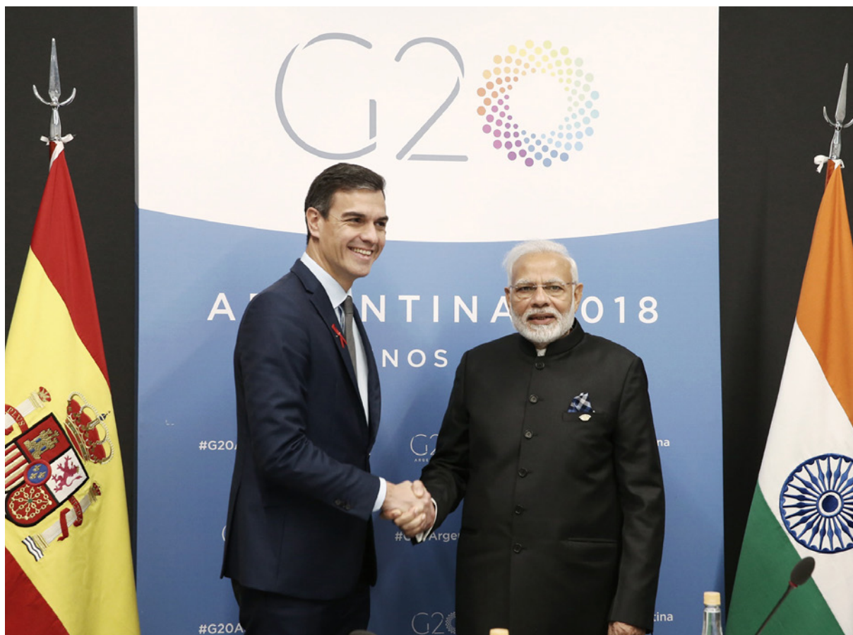
El presidente del Gobierno, Pedro Sánchez, saluda al primer ministro de la India, Narendra Modi, en la Cumbre del G-20 de 2018.

implementación de la Convención Marco de Naciones Unidas sobre Cambio Climático, su Protocolo de Kioto y el Acuerdo de París. Dentro de este componente multilateral de cumplimiento de los objetivos de la Agenda 2030 y de la lucha contra el cambio climático existe una dimensión bilateral que permite obtener enormes sinergias para la cooperación entre los dos países. Por un lado, la colaboración en tecnologías eficaces para aumentar nuestra resiliencia ante el impacto negativo del cambio climático en España e India. Por otro, la experiencia en la gestión sostenible del agua, tanto en su uso eficiente en los ámbitos urbano, rural e industrial como en el tratamiento