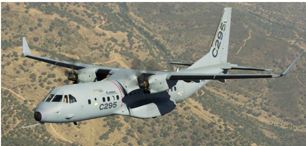
Avión Airbus C-295.

En el ámbito aeronáutico, a finales de 2019 se avanzó en la compra por parte del gobierno de India de 56 aviones Airbus C-295 de los que los primeros 16 aviones se fabricarían en Sevilla y los restantes 40 en India en alianza con el grupo Tata. Indra ha cerrado en 2020 un contrato para el suministro de sistemas de ayuda a la navegación para 37 bases aéreas de la India, acuerdo que se enmarca en el proyecto del Ministerio de Defensa indio para la modernización de la infraestructura de las bases aéreas del país.