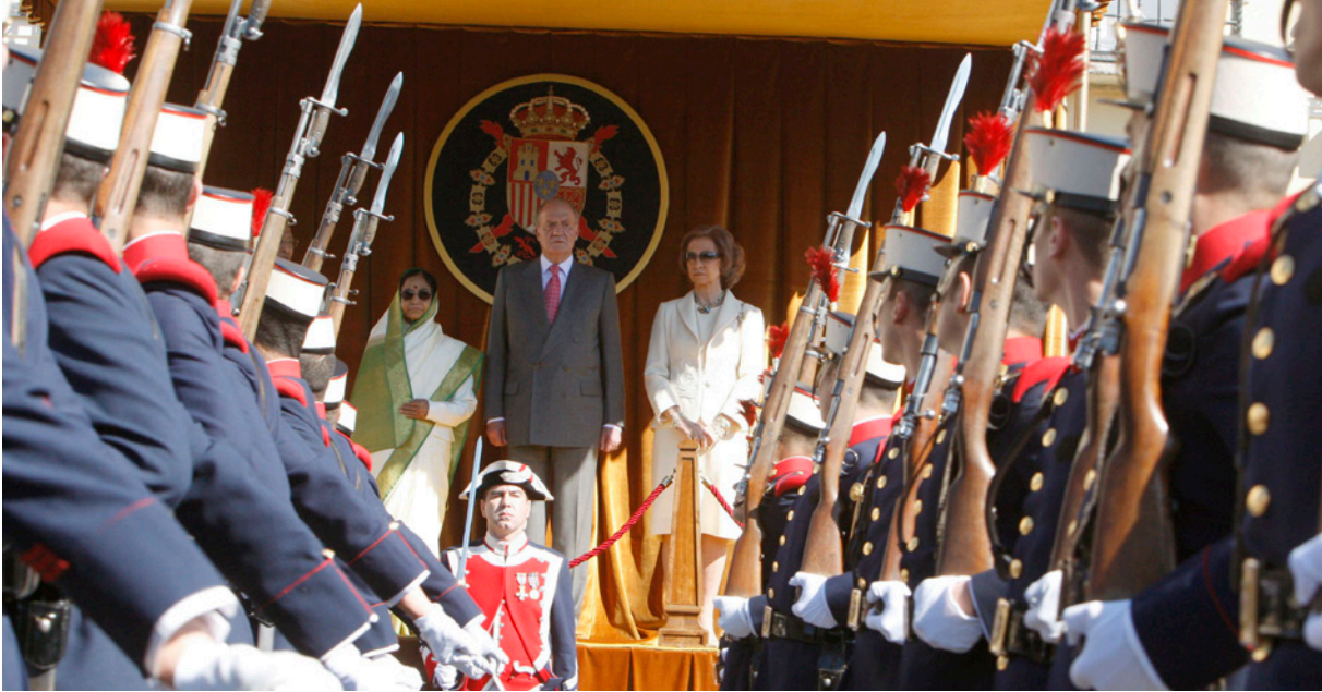
Pratibha Patil recibe los honores de la Guardia Real durante su visita a España en abril de 2009.

India no existen irritantes bilaterales, hay buena sintonía entre sus líderes, concurren las sinergias necesarias para el crecimiento mutuo y, además, España demuestra, por la vía de los hechos, que India es su principal socio en Asia Meridional.