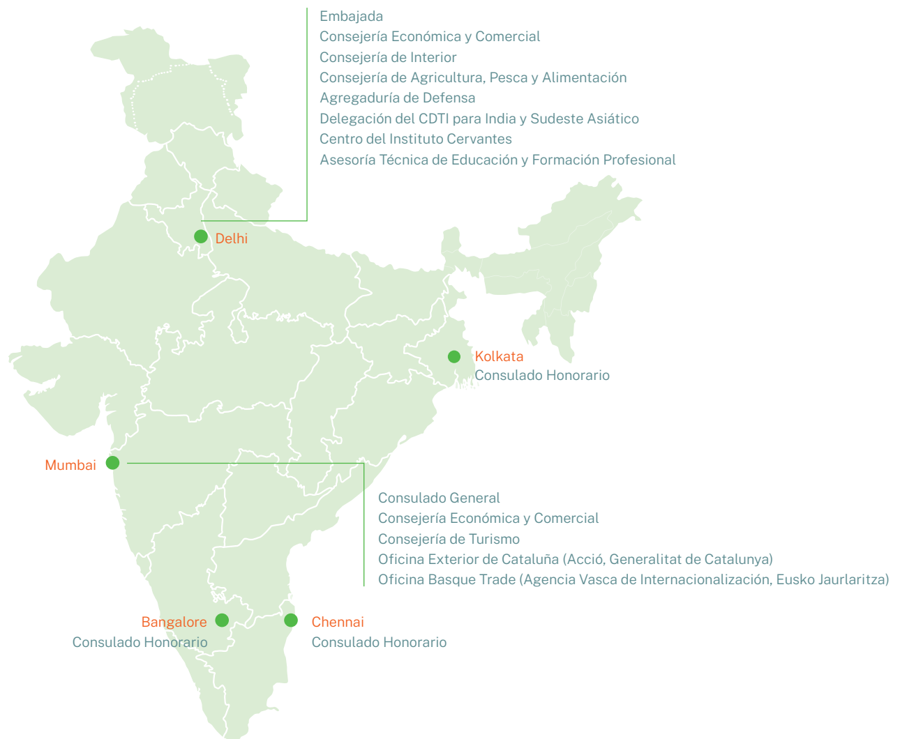
ILUSTRACIÓN 5 / Representación estatal y autonómica de España en India

Fuente: Ministerio de Asuntos Exteriores, Unión Europea y Cooperación; Generalitat de Catalunya; Eusko Jaurlaritza.